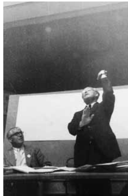
Sigfried Giedion am CIAM-Kongress in Bridgwater 1947.